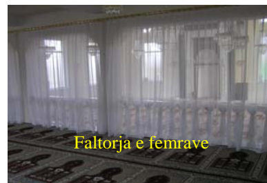
Faltorja e femrave